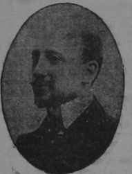
GABRIEL D'ANNUNZIO CABIRIA

REPARARBE LA VISION HISTORICA DE GABRIEL D'ANNUNZIO